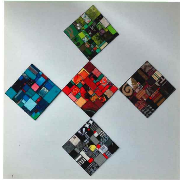
「カラフルタイル」 (mixed media：布・両面テープ・アラビア糊・水彩絵の具)